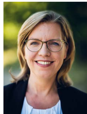
Bundesministerin Leonore Gewessler

Dafür möchte ich mich bei Ihnen allen sehr herzlich bedanken und freue mich auf den Besuch meines nächsten Green Event!