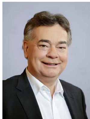
Vizekanzler Werner Kogler

Ich möchte Sie einladen, Ihre Sport- oder Kulturveranstaltung als Green Event auszurichten und damit einen aktiven Beitrag zu Nachhaltigkeit und Klimaschutz zu leisten.