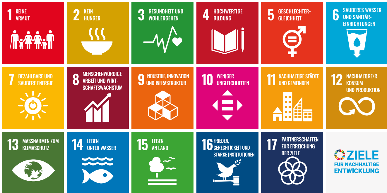
Darstellung der 17 SDGs