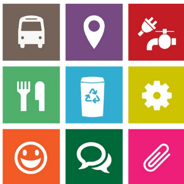
Themenfelder Infothek Green Events

Das webbasierte Portal bündelt Informationen entlang der acht Green Events Themenbereiche und ist Plattform für Veranstalter:innen, Produzent:innen und Dienstleister:innen: infothek.greenevents.at .